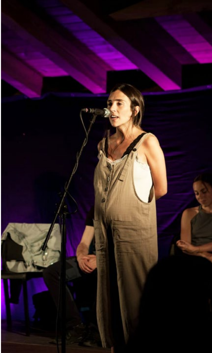
Aixita sariketa. Irurtzun. 2022-05-14.