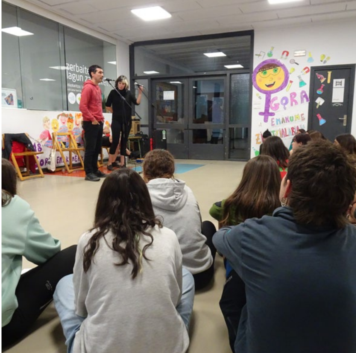
Udako bertso barnetegia. Ondarroa. 2022-06-29.