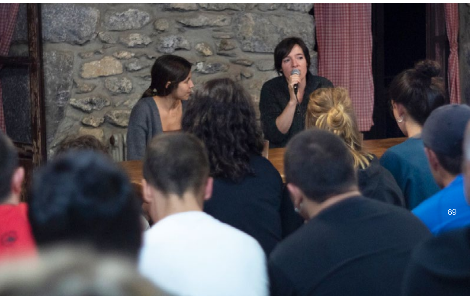
Bertso Udalekuetako bertso afaria. Larraul. 2022-07-28.