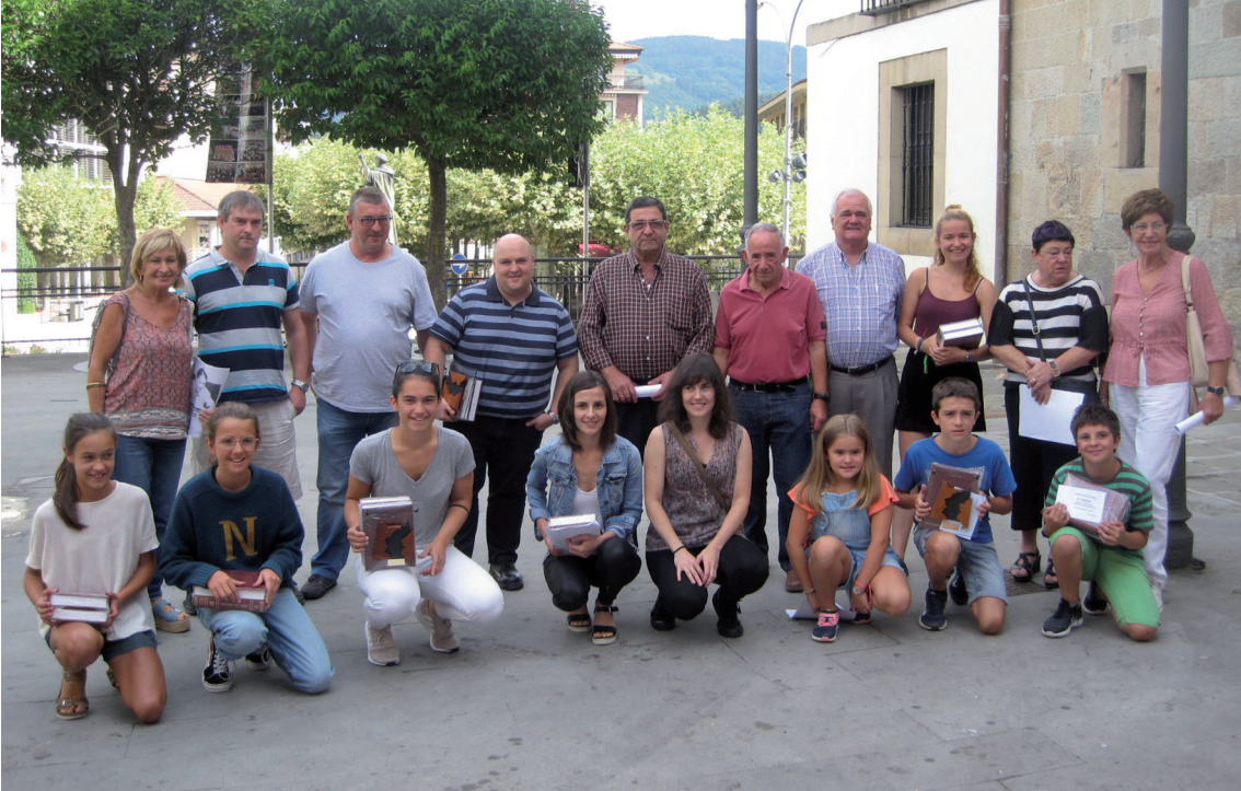
XXVIII. Lazkao Txiki Bertsopaper Lehiaketako sarituak.

Birigarroa zugaitzean da xoxoa sasi onduan, gaur goizeane eginahalean hor ari ziran kantuan. Kukua berriz zugaitzik zugaitz kuku hemen da kuku han kalendario gabe badaki noiz etorri ta noiz juan.